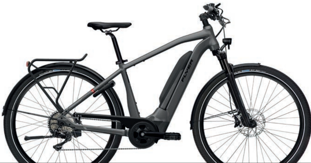
Upstreet 5 7.10 Anthracite Gloss, Gents

Produktabbildungen können von den Spezifikationen abweichen. Farben können abweichen.