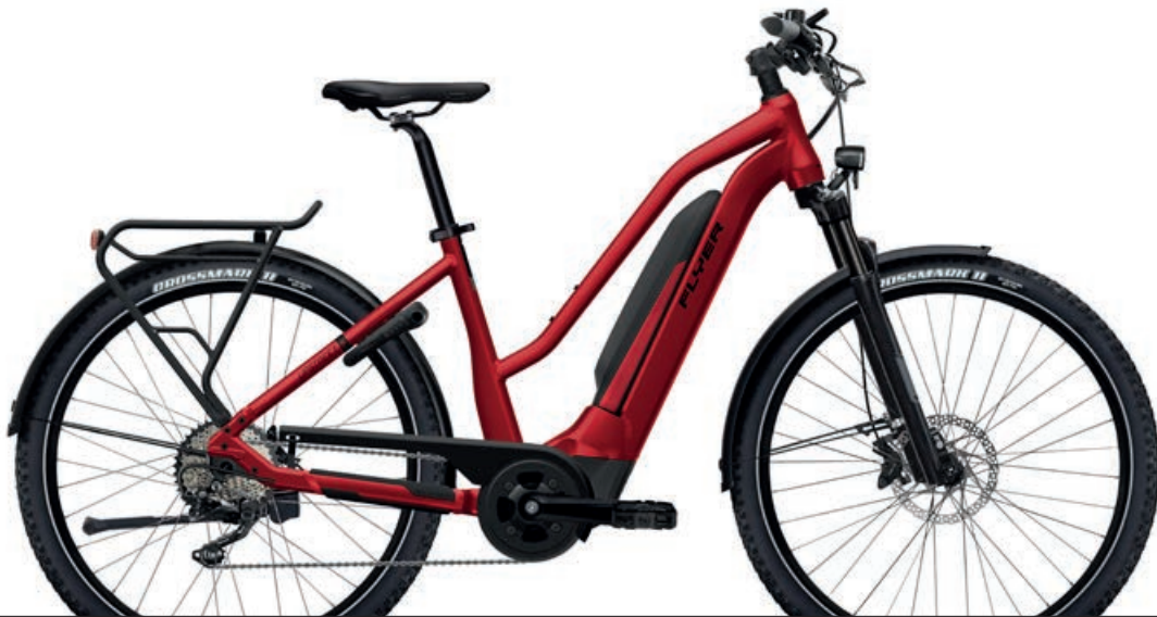
Upstreet 5 7.12 XC Mercury Red Gloss, Mixed